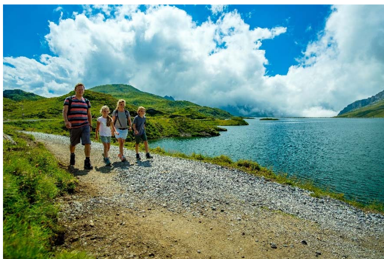
Tannensee auf Melchsee-Frutt