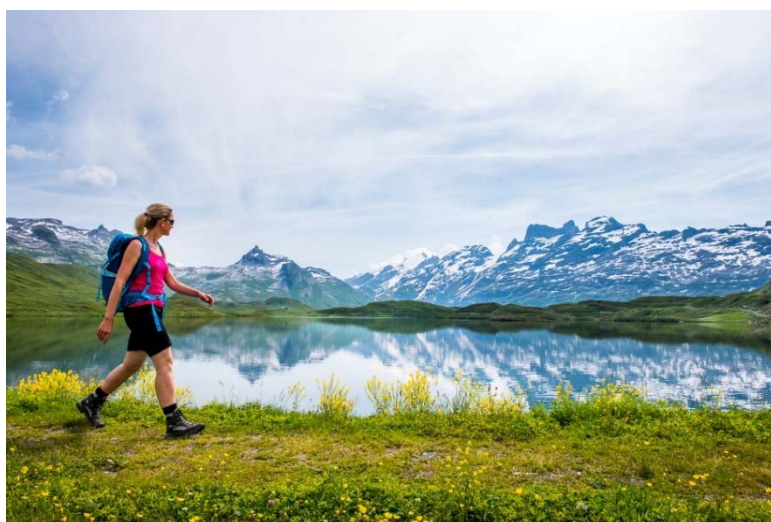
Tannensee auf Melchsee-Frutt