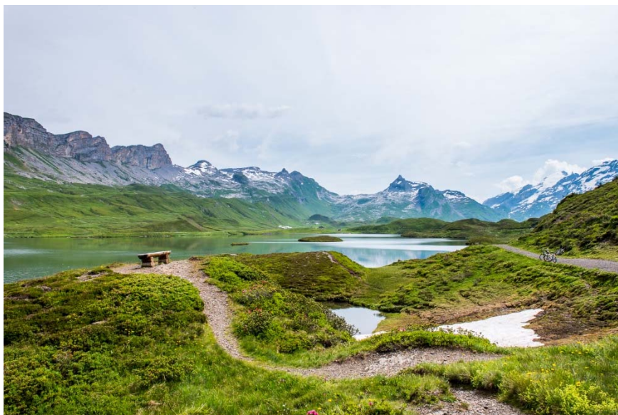
Tannensee mit Graustock im Hintergrund